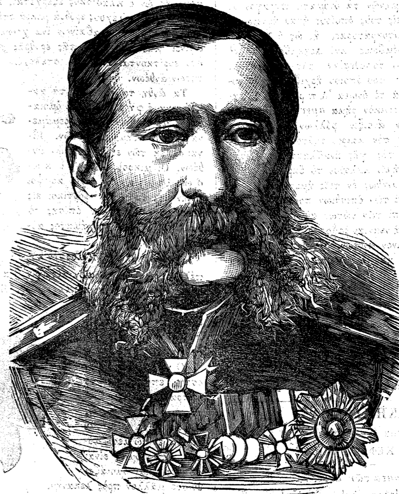
Ο ΣΤΡΑΤΗΓΟΣ ΛΟΡΙΣ ΜΕΛΙΚΩΦ

Ὅλοι βεβαίως γνωρίζουσι τὴν γεωγραφικὴν θέσιν τῆς Σουηδίας· δὲν θέλομεν δώσει ἐπ' αὐτῶν ἡ σημαγραφίαν τοῦ βίου των καὶ τῆς ζωῆς των.